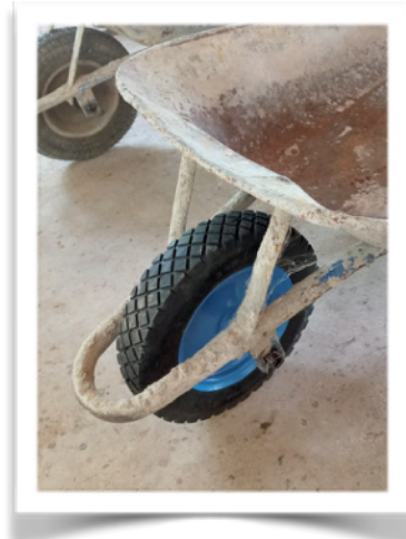
En een nieuw krulwagenwiel.