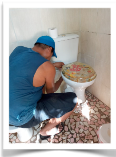
Ook de WC bril is weer stevig gemonteerd