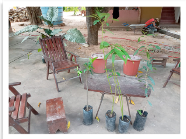
2 nieuwe avocado, 1 grapefruit, en 1 groen olijfboompje

Ook voor de tuin zijn er weer een paar jonge boompjes bijgekomen