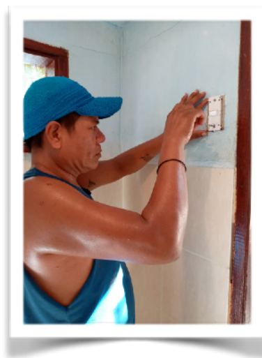
En defecte elektriciteitsschakelaars vervangen

Ook hebben we een aantal aankopen kunnen doen voor materialen die bijna dagelijks gebruikt worden.