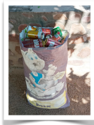
In Bolivia worden de lege blikjes verzameld en verkocht. 17,5 Bolivianos voor 3,5kg deze keer.

Er zijn nog een hoop werkzaamheden te verwezenlijken waar we hulp bij nodig hebben. Er zijn o.a. een aantal kleine en grotere waterreservoirs met houten deksels die aan vervanging toe zijn. We proberen dit aan te pakken zodra er voldoende middelen en mankracht beschikbaar is.