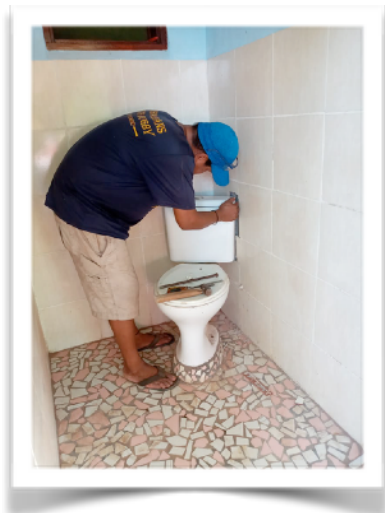
De toiletten zijn weer lekkage vrij

Naast de kleine herstel en onderhoudswerkzaamheden die zijn verricht is het dak van het gastenverblijf en de opslagruimte voor een 2e keer geschilderd.